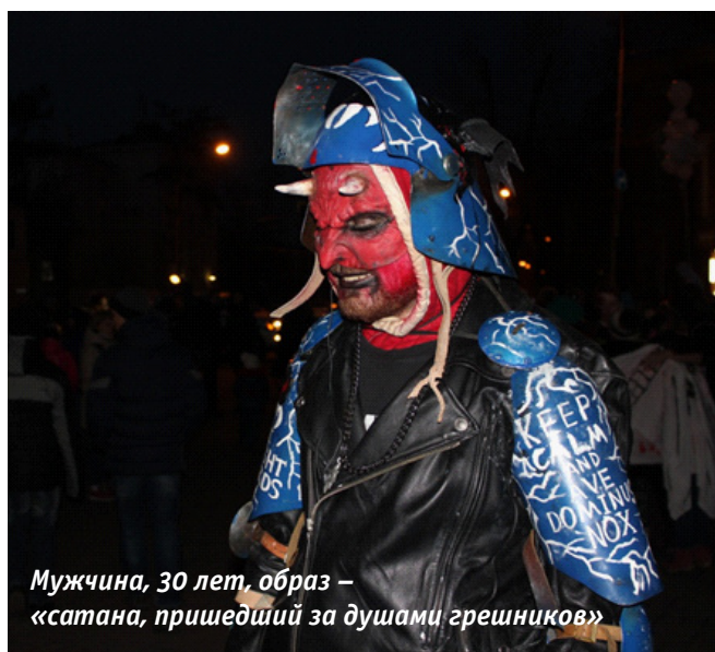
Мужчина, 30 лет, образ – «сатана, пришедший за душами грешников»

Публичное празднование Хэллоуина нарушает нормы, отраженные в положениях ФЗ 436 «О защите детей от информации, причиняющей вред их здоровью и развитию».