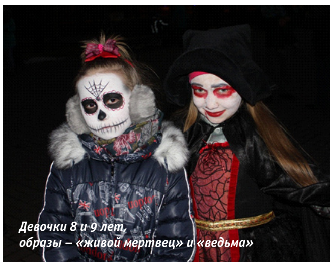
Девочки 8 и 9 лет, образы – «живой мертвец» и «ведьма»

Полученная в процессе качественной и количественной обработки полученных диагностических данных обобщенная характеристика поведения участников праздника позволяет оценивать его как навязчивое, легкомысленное и социально-неприемлемое. Герои праздника воспринимаются противоречиво: с одной стороны, они страшные, противные, агрессивные, отличающиеся пугающим и неадекватным поведением, а с другой – веселые, общительные, активные и доброжелательные. Такое противоречие свидетельствует о наличии диссонанса, возникающего как у участников праздника, так и у его зрителей. Причем показано, что этот диссонанс возникает не только на когнитивном уровне, но на эмотивном и поведенческом.